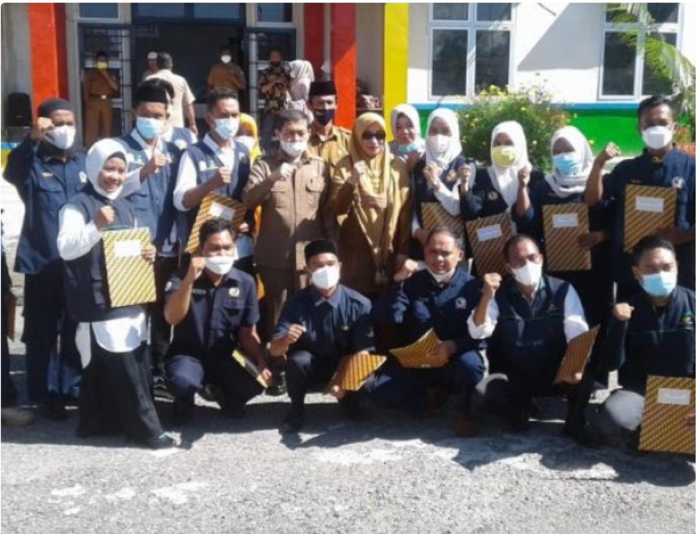
Gambar : Sekda Aceh Tenggara Poto Bersama 16 Anggota TKSK

Aceh Tenggara - Sekretariat Daerah (Sekda) Kabupaten Aceh Tenggara mengukuhkan dan sekaligus membagikan Surat Keputusan (SK) kepada 16 orang Tenaga Kesejahteraan Sosial Kecamatan (TKSK) se-Kabupaten Aceh Tenggara, di Depan Kantor Dinsos Aceh Tenggara. Selasa (12/04/2022).